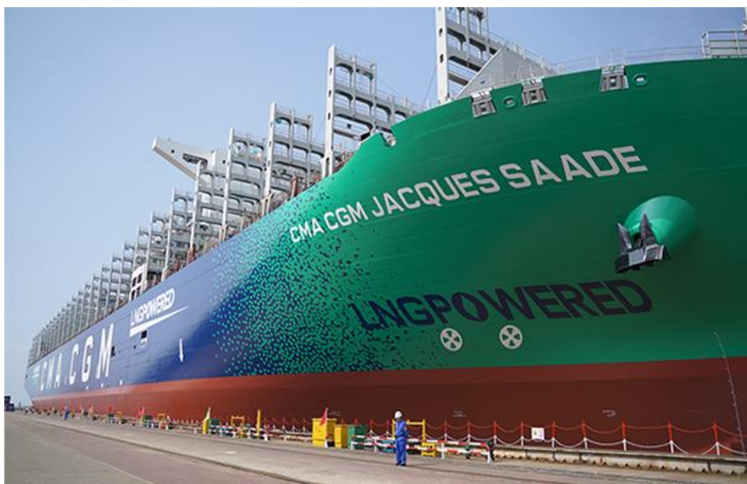
Figura 4 – CMA CGM Jacques Saadé

O modelo em questão está de acordo com a Figura 4. Ele é resultado de aproximadamente 7 anos de pesquisas, desenvolvido por especialistas e parceiros industriais. De acordo com a empresa além da motorização a gás natural, o navio conta com cockpit com as mais recentes tecnologias digitais para auxiliar o comandante e a tripulação.