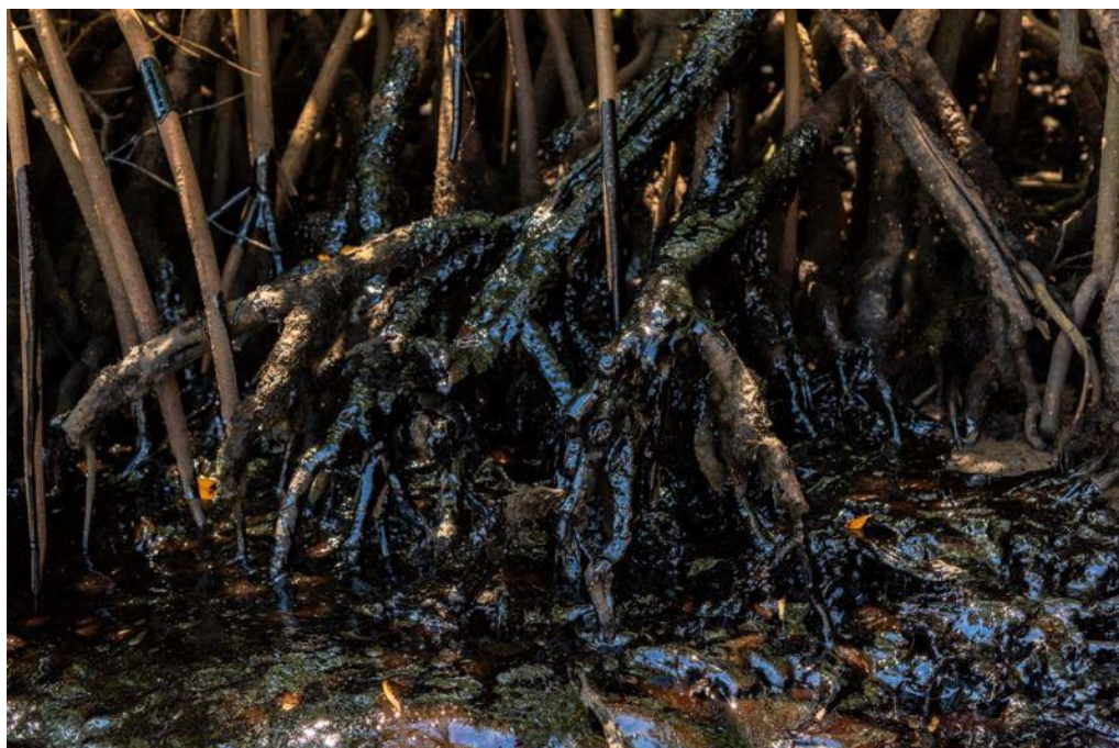
Figura 2 - Óleo no litoral do Nordeste

No ano de 2019, manchas de óleo foram encontradas no litoral do nordeste brasileiro, conforme Figura 2, causando grande impacto na economia local, pois animais de grande importância para o comércio foram afetados pelo crime ambiental. Em consequência, a recomendação foi a paralisação da pesca prejudicando cerca de 300 mil pescadores diretamente (BBC, 2020).